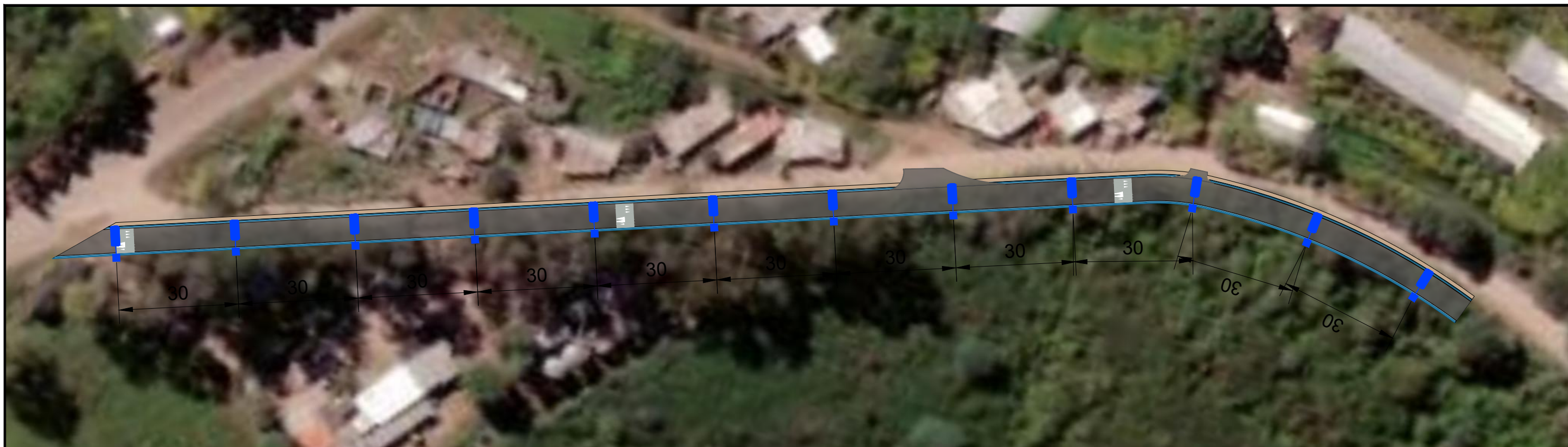
IMPLANTACIÓN DE LUMINARIAS